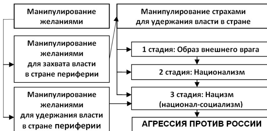
Рисунок 1 – Базовый комплекс инструментов ГЦК, используемых для сохранения власти при глобальных пределах роста

Для того, чтобы на практике использовать этот комплекс инструментов в той или иной стране периферии мировой финансовой системы, ГЦК необходимо иметь эффективные рычаги влияния на национальный капитал (например, компрадорскую буржуазию и олигархию), контролирующей средства массовой информации. Как показывает опыт Украины, чтобы получить такие рычаги, ГЦК достаточно провести цветную революцию в той или иной стране периферии мировой финансовой системы. В результате этого фактическая власть в этой стране переходит к ГЦК.